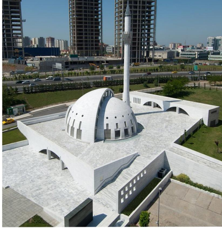
صوره رقم (15) مسجد يسلي فادي في تركيا