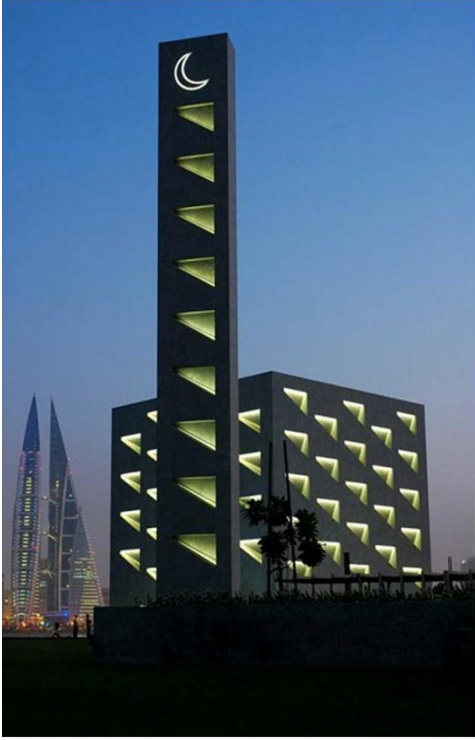
صوره رقم (16) مسجد إيست بارك في المنامة

للتشكيل المعماري واتجاهاته الإبداعية في بدايات القرن الحادي والعشرين