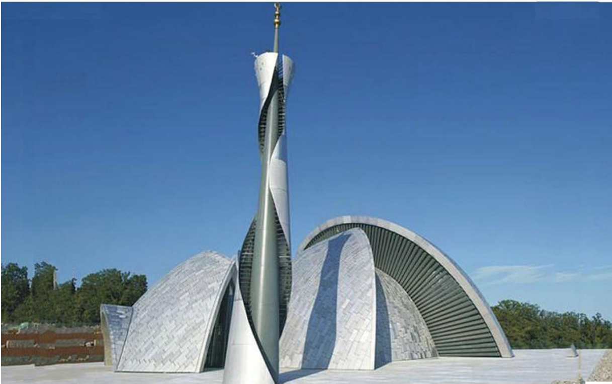
صوره رقم (17) مسجد في ريكا للنحات دوسان دوزمنجا أحد أشهر نحاتي كرواتيا